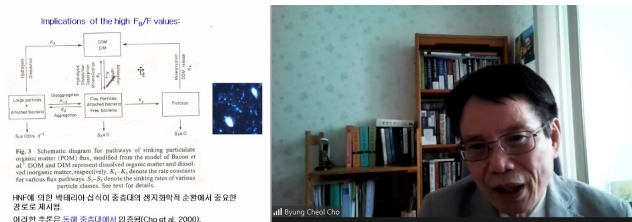
[특별강연 - 조병철]

○ 참 석 자 : 공동학술대회 기획위원, 회장 우리 학회에서는 김부근 회장(협의회 회장), 박장준 이사(협의회 이사) 참석